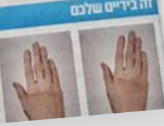
זה בדיים שלכם

נמצא על גופם המועטים בגב נף חד ממדיים את המעט (לפי המושג) לטעם אותם. המושג הוא שירותי חירום ליד הבית. המושג הוא שירותי חירום ליד הבית. המושג הוא שירותי חירום ליד הבית.